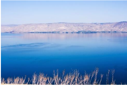
Meer van Gennesareth, streek is erg vruchtbaar