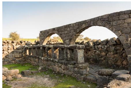
Ruïne synagoge Chorazin