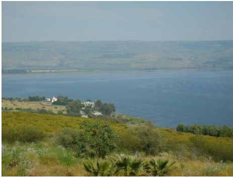
Kapernaüm, en meer van Galilea

Belangrijke plaats aan de Noord Oost kant van het Meer van Galilea in Israël. Stad waar aan het begin van onze jaartelling vooral vissers en handelaars woonden, met een sterke inbreng van de Romeinse overheid. Jezus en een aantal van zijn discipelen woonden er. Jezus heeft hier een aantal discipelen, Petrus, Andreas, Johannes, Jacobus, Mattheüs, gevraagd om met hem mee te gaan.