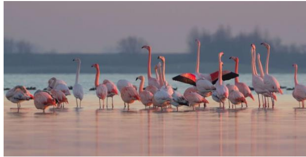
Flamingo's bij Battenoord ( Goeree Overflakkee)