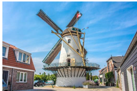
Molen Korenlust ( Molendatabase)