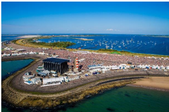
Concert at Sea