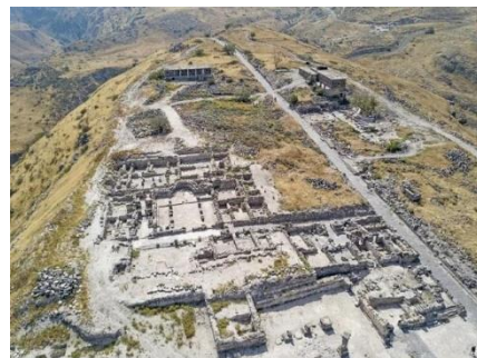
Restanten van het vroege Christendom