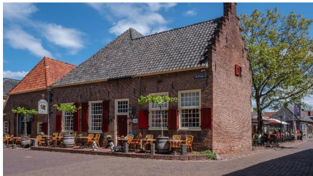
Paus Adrianus VI voor Catharinakerk , Hotel Restaurant De Gouden Leeuw ( paushuis)

Pastoor Adriaen kreeg de naam Adrianus VI toen hij tot paus werd gewijd in Rome. Adrianus van Nicomedia, was een Romeins legerofficier ( 278-304 of 306), hoofd van de Romeinse gevangenisbewakingsdienst. Hij raakte erg onder de indruk van het geloof en de standvastigheid, van christenmartelaren, en sloot zich bij de christenen aan. Gevolg daarvan was dat Adrianus zelf ook een martelaar werd.