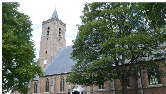
Hervormde Kerk Dirksland, Joh. de Doper

De oude kerk in Dirksland, uit 1416, werd eerst de St.Johannes(Jans) de Doper Kerk genoemd. In de kerk is een mooi fresco van Jan van Scorel aanwezig, waarop de beschermheer, en noodhelper, Christoffel is afgebeeld.