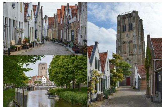
Deltahaven ( Bram Pronk Schuttevaer), Duingebied, centrum Ouddorp ( Weekend Toerist)