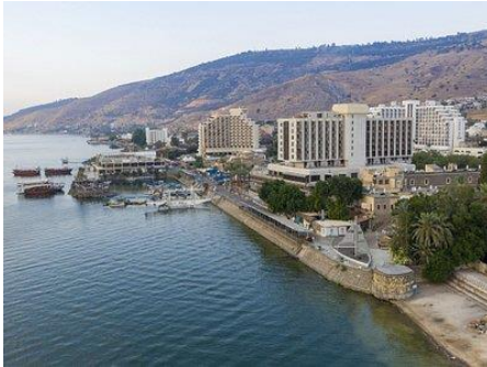
Tiberias in deze eeuw

Tiberias is op dit moment de grootste plaats aan het Meer van Galilea ( Meer van Tiberias) Het was een belangrijke stad voor de Romeinen, deze plaats aan de westkant van het meer. Nog steeds kent het heetwaterbronnen, een mooi strand, en belangrijke centra voor de handel. Samen met de plaats Hammath trekt Tiberias veel toeristen.