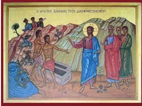
Twee bezetenen worden door Jezus bevrijd

Over deze plaats is niet zoveel bekend, alleen dat de discipelen en Jezus er langs zijn gekomen. Op dat moment komen er twee bezetenen op Jezus af. We lezen dan dat Jezus ze bevrijd van demonen. De demonen verlaten de twee, en trokken in een kudde varkens. De varkens stortten zich dan, van de steile rotsen, in het Meer van Galilea. Het gebied van Gerasenen was niet Joods, vandaar dat er ook varkens werden gehoed.