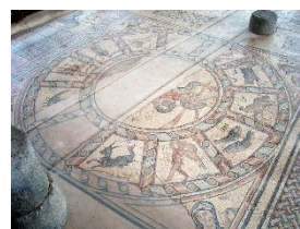
vloer oude synagoge