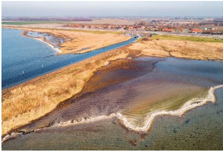
Slikplaten bij Battenoord

Battenoord is een kleine plaats, vlakbij Nieuwe Tonge. Het is vooral bekend vanwege de bijzondere vogels die naar de slikplaten toekomen. Battenoord is vooral verbonden met Nieuwe- Tonge, wordt er qua inwonersaantal ook toe gerekend. De omgeving van Nieuwe- Tonge is vooral op land- en tuinbouw gericht ( uien- en bollenteelt).