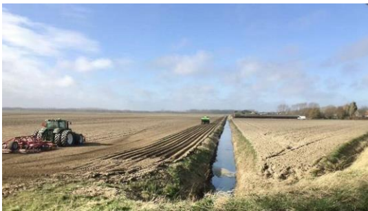
Adrianapolder ( Waterschap Holland Delta)

Op de plaats waar nu Stellendam ligt lag eerst een eiland, met de naam Zomerland. Met de aanleg van de Statendam in 1765, tussen Westvoorn en Overflakkee, kon er bedijkt worden. Eerst werd de kwelder(gors) aan de kant van het eiland Goeree bedijkt, zo ontstond in 1769 de Adrianapolder . In 1780 werden alle kwelders tussen Goeree en Overflakkee ingedijkt, zo ontstond de Eendragtspolder. Later werd het, met de komst van het dorp Stellendam, de Stellendamse polder genoemd. De vissers van Stellendam zijn, net als de vissers uit Ouddorp en Goedereede, uitgeweken naar de Deltahaven. Dat is nu al jaren de thuishaven voor ongeveer 50 vissersschepen. De polders zijn nu grote landbouw gebieden. Het vraagt elke keer veel inzet van Waterschap Holland Delta om de polders zoet te houden.