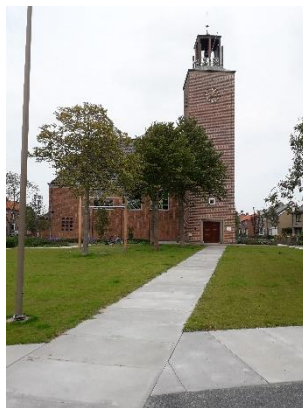
Bethlehemskerk met gedenksteen,

Klooster Bethlehem ( Kloosteroute - zie www.kloosterwelle.nl )