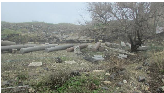
Hippos – Verwoeste Kathedraal

Hippos is de enige stad aan het Meer van Galilea(oostkant) met een Bisdom. Keizer Constantijn, de Romeinse Keizer, die zich tot het christendom had bekeerd, stelde er een bisschop aan. Ook voor het Byzantijnse Rijk was Hippos een belangrijke stad. Een stad met veel tempels, synagogen, arena's, badhuizen, e.a. Waar verschillende culturen samenkwamen.