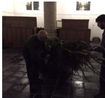
kerstboom opzetten en versieren