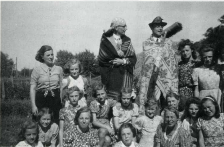
Weekend met de 'kleine meisjes-club', Zierikzee 1942 (foto familiearchief).