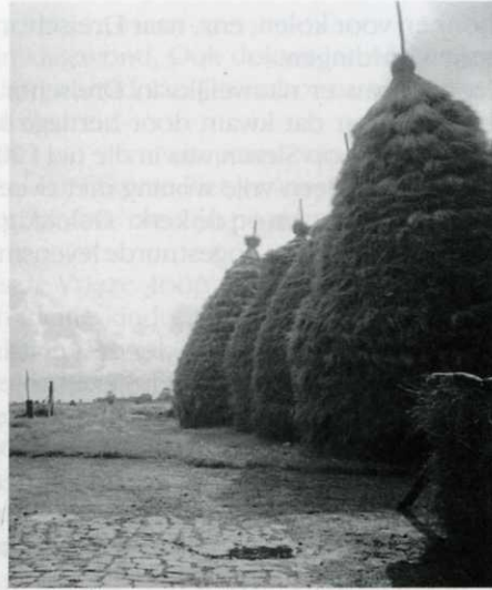
Vlastollen', zomer 1940.

De volgende ochtend vroeg (ze konden niet wachten tot de middag!) hoor ik ineens een fijn stemmetje aan de achterdeur: "vollek". Daar stond de bende weer, vol verwachting. De "vollek" roeper had een pijp gemaakt van een groote kastanje en rookte dorre blaren (later vond ik zijn stopseltje in het gras). Ik zei: jongens uit de weg en gooide de hark tot bovenin de boom. Die bleef hangen. Een gejuich. Ik haal de schoffel en gooi hem d'r in: die blijft ook bovenin hangen! Toen de bezem. Die bleef ook hangen. Toen de ragebol. En die bleef ook hangen. Door de blaren heen zag je ze alle vier zitten. Die jongens stonden te dansen van leedvermaak. Toen alles er weer uit was en de jongens naar boven stonden te loeren, kreeg er een jochie een groote bolster met stekels en al op zijn neus."