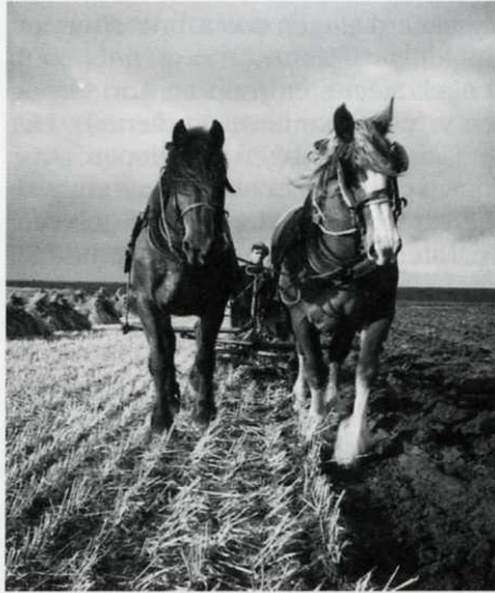
Ploegende boer, zomer 1940.