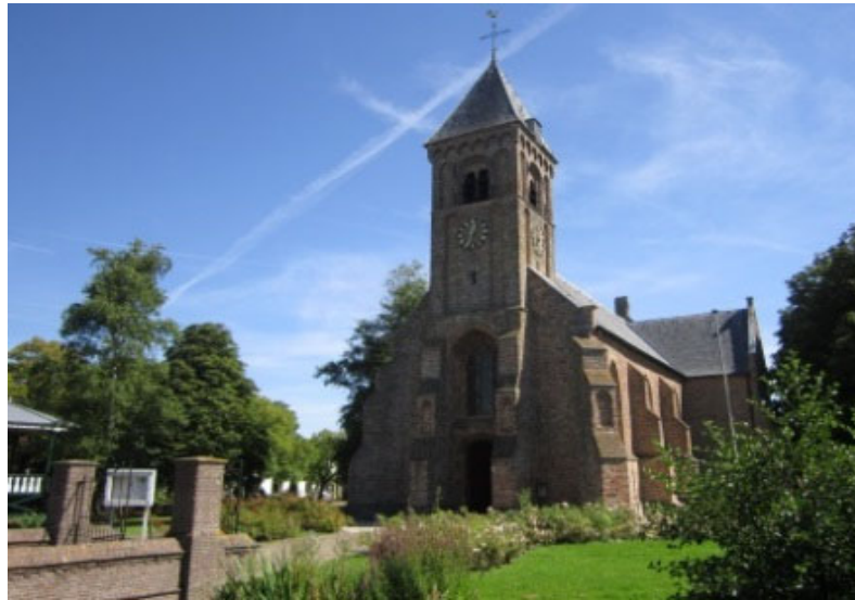
Driekoningenkerk te Noordgouwe