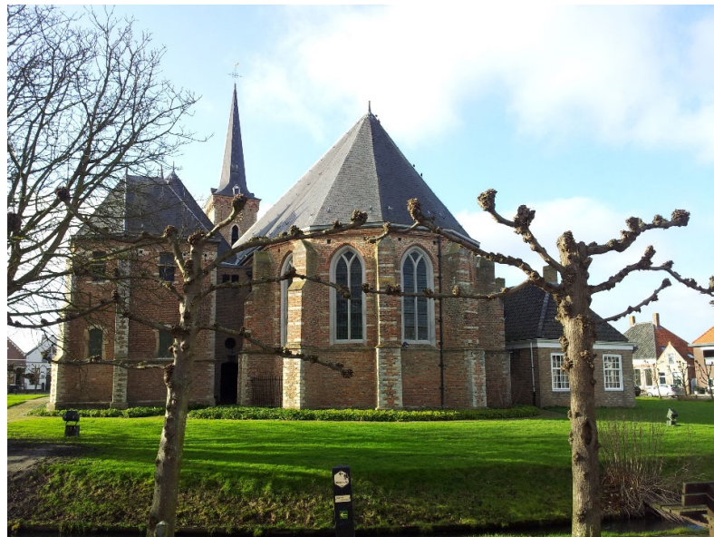
Adriaanskerk te Dreischor

Protestantse Gemeente Dreischor-Noordgouwe